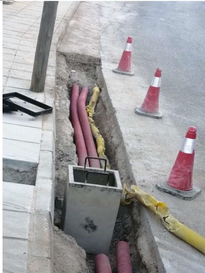
2019/2/EBCAR-040.- REDUCCIÓN DE EMISIONES DE CO2 EN EL ALUMBRADO PÚBLICO EXTERIOR DEL MUNICIPIO DE BENALUA DE LAS VILLAS, POR LA APLICACIÓN DE TECNOLOGÍAS EFICIENTES ENERGÉTICAMENTE” EN EL MARCO PROYECTOS SINGULARES DE ECONOMÍA BAJA EN CARBONO PARA SER COFINANCIADOS MEDIANTE EL PROGRAMA OPERATIVO FEDER DE CRECIMIENTO SOSTENIBLE 2014-2020