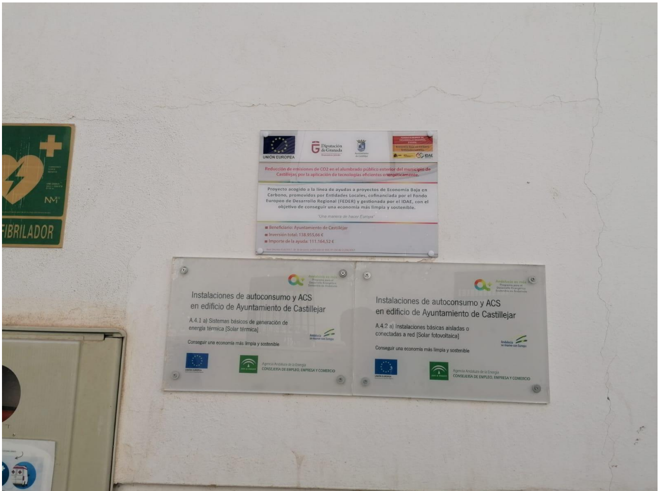
2019/2/EBCAR-51 "CASTILLÉJAR, Reducción de emisiones de CO2 en el alumbrado público exterior del municipio de Castillejar por aplicación de tecnologías eficientes energéticamente". EN EL MARCO PROYECTOS SINGULARES DE ECONOMÍA BAJA EN CARBONO PARA SER COFINANCIADOS MEDIANTE EL PROGRAMA OPERATIVO FEDER DE CRECIMIENTO SOSTENIBLE 2014-2020

Dirección General de Obras Públicas y Vivienda