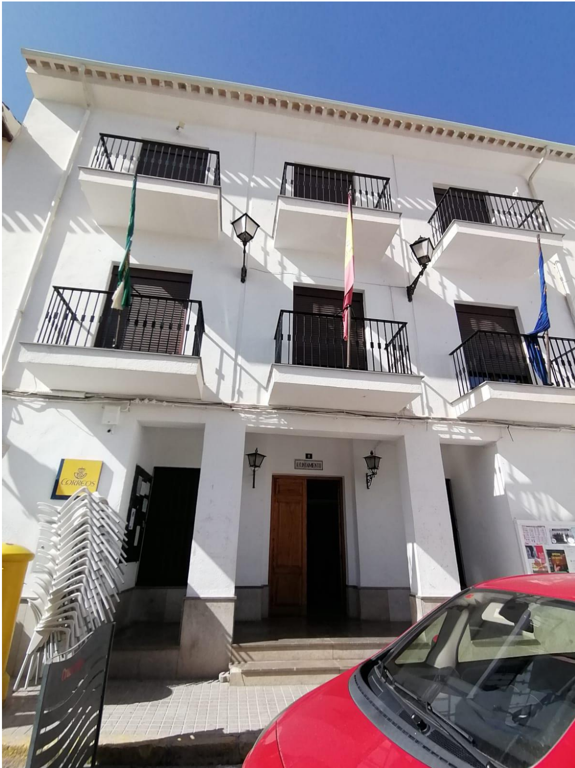
2019/2/EBCAR-51 "CASTILLEJAR, Reducción de emisiones de CO2 en el alumbrado público exterior del municipio de Castelléjar por aplicación de tecnologías eficientes energéticamente". EN EL MARCO PROYECTOS SINGULARES DE ECONOMÍA BAJA EN CARBONO PARA SER COFINANCIADOS MEDIANTE EL PROGRAMA OPERATIVO FEDER DE CRECIMIENTO SOSTENIBLE 2014-2020

Dirección General de Obras Públicas y Vivienda