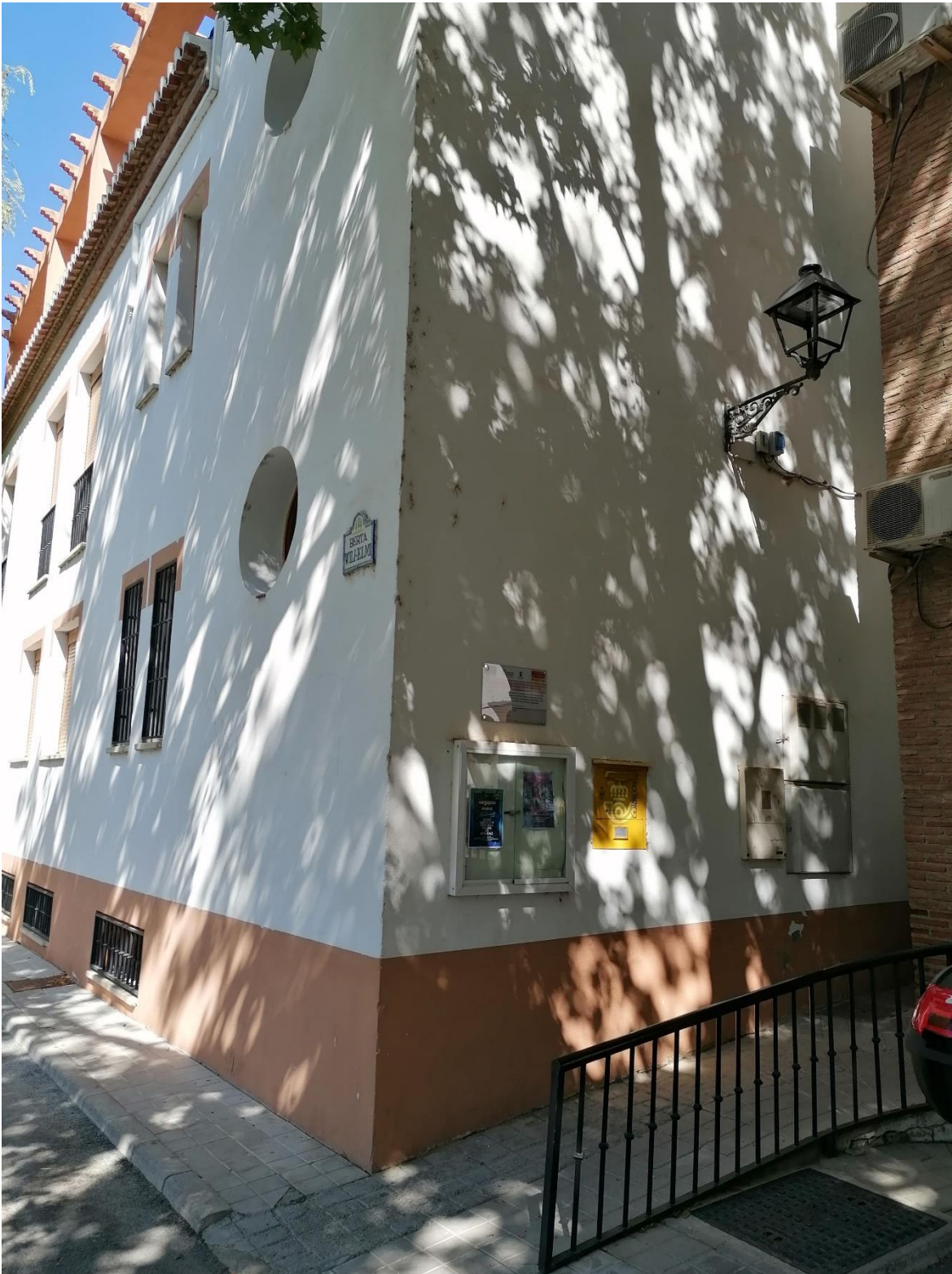
2019/2/EBCAR-270.- REDUCCION DE EMISIONES DE CO2 EN EL ALUMBRADO PUBLICO EXTERIOR DEL MUNICIPIO DE PINOS GENIL, POR LA APLICACIÓN DE TECNOLOGÍAS EFICIENTES ENERGÉTICAMENTE” EN EL MARCO PROYECTOS SINGULARES DE ECONOMÍA BAJA EN CARBONO PARA SER COFINANCIADOS MEDIANTE EL PROGRAMA OPERATIVO FEDER DE CRECIMIENTO SOSTENIBLE 2014-2020

Dirección General de Obras Públicas y Vivienda