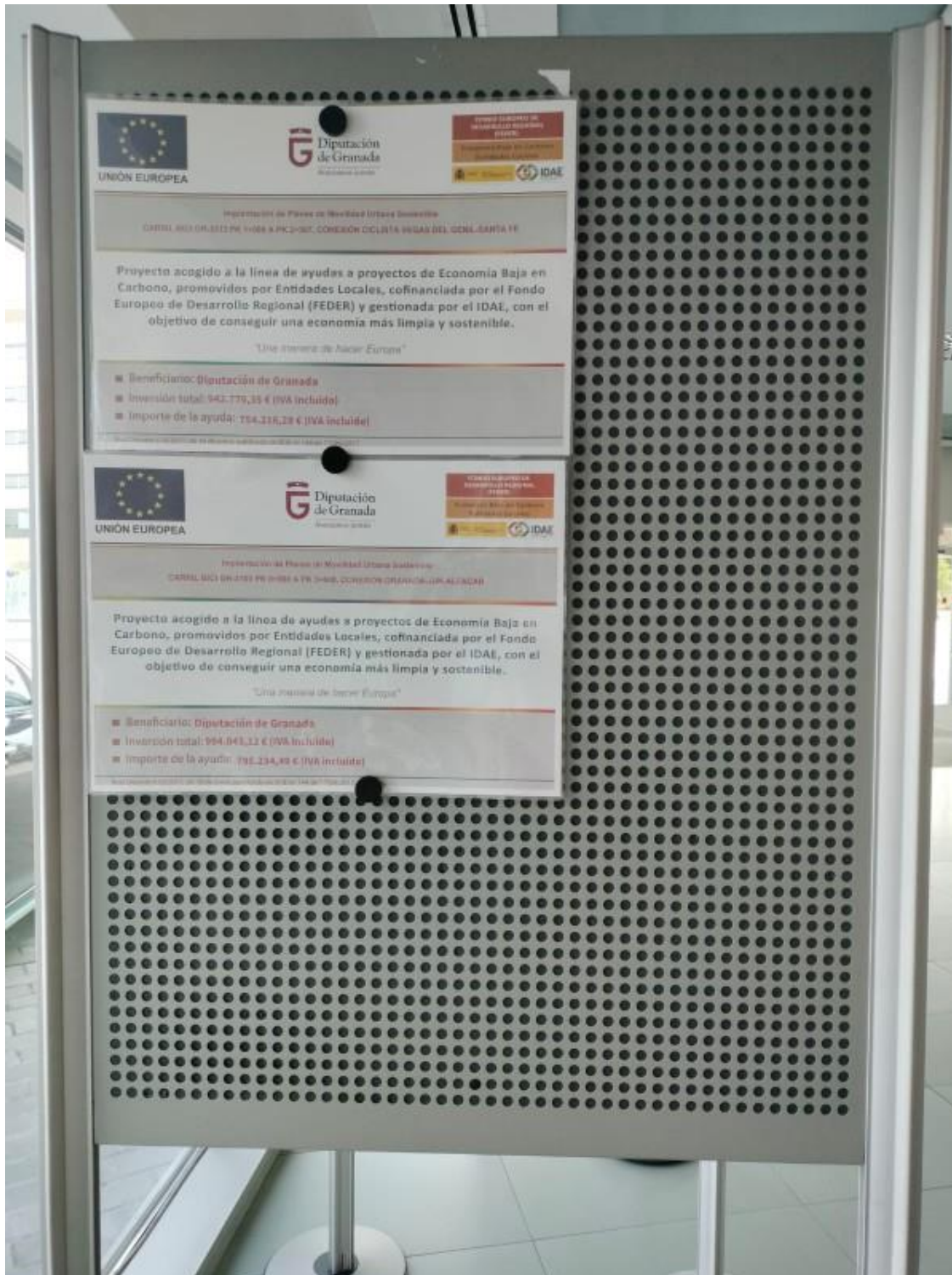
FEDER-EELL-2019-000912. 2019/2/BICI3 313 "DIPUTACIÓN, Carril bici GR-3313 PK 1+000 a PK 2+507, conexión ciclista Vegas del Genil-Santa Fe". EN EL MARCO PROYECTOS SINGULARES DE ECONOMÍA BAJA EN CARBONO PARA SER COFINANCIADOS MEDIANTE EL PROGRAMA OPERATIVO FEDER DE CRECIMIENTO SOSTENIBLE 2014-2020

Dirección General de Obras Públicas y Vivienda