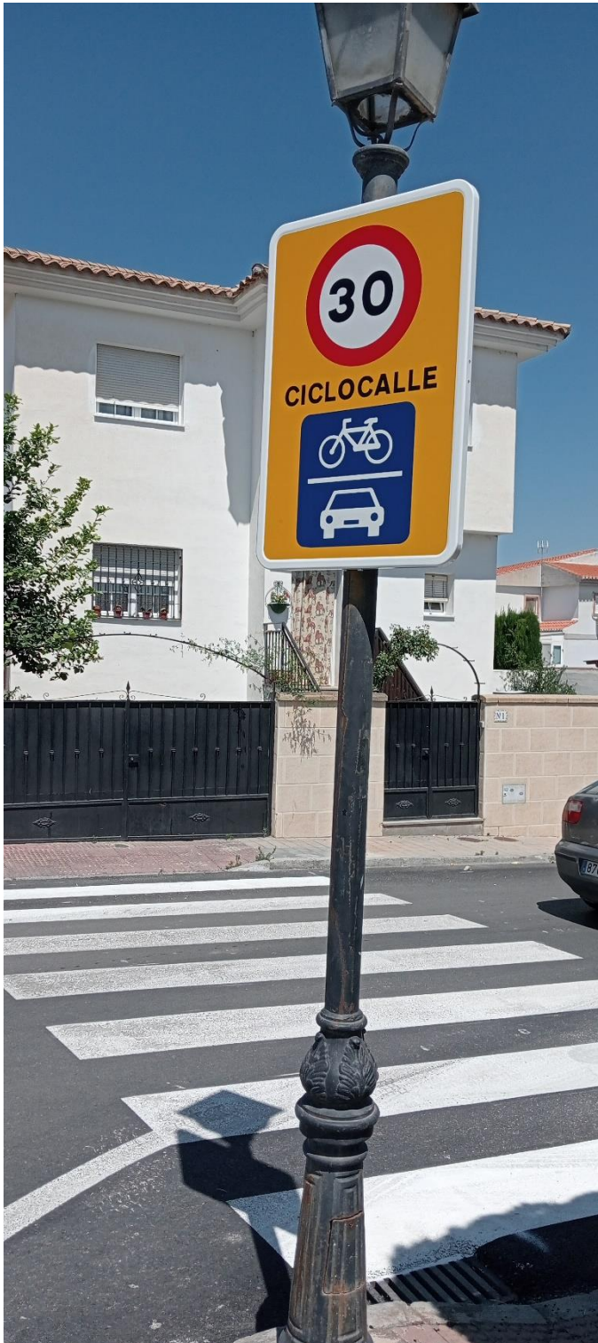
FEDER-EELL-2019-000912. 2019/2/BICI3 313 "DIPUTACIÓN, Carril bici GR-3313 PK 1+000 a PK 2+507, conexión ciclista Vegas del Genil-Santa Fe". EN EL MARCO PROYECTOS SINGULARES DE ECONOMÍA BAJA EN CARBONO PARA SER COFINANCIADOS MEDIANTE EL PROGRAMA OPERATIVO FEDER DE CRECIMIENTO SOSTENIBLE 2014-2020

Dirección General de Obras Públicas y Vivienda