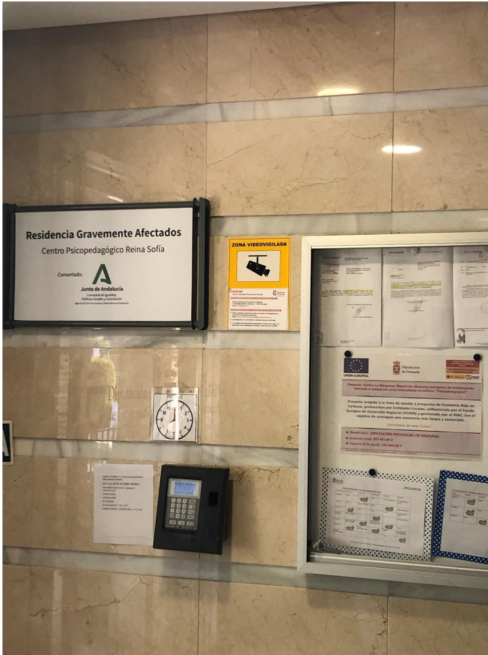
2021/2/REDIP/1-8.- Proyecto: Centro La Milagrosa. Mejora de eficiencia energética de instalaciones térmicas y Instalación solar fotovoltaica en edificio “Psicopedagógico” EN EL MARCO PROYECTOS SINGULARES DE ECONOMÍA BAJA EN CARBONO PARA SER COFINANCIADOS MEDIANTE EL PROGRAMA OPERATIVO FEDER DE CRECIMIENTO SOSTENIBLE 2014-2020

Dirección General de Obras Públicas y Vivienda