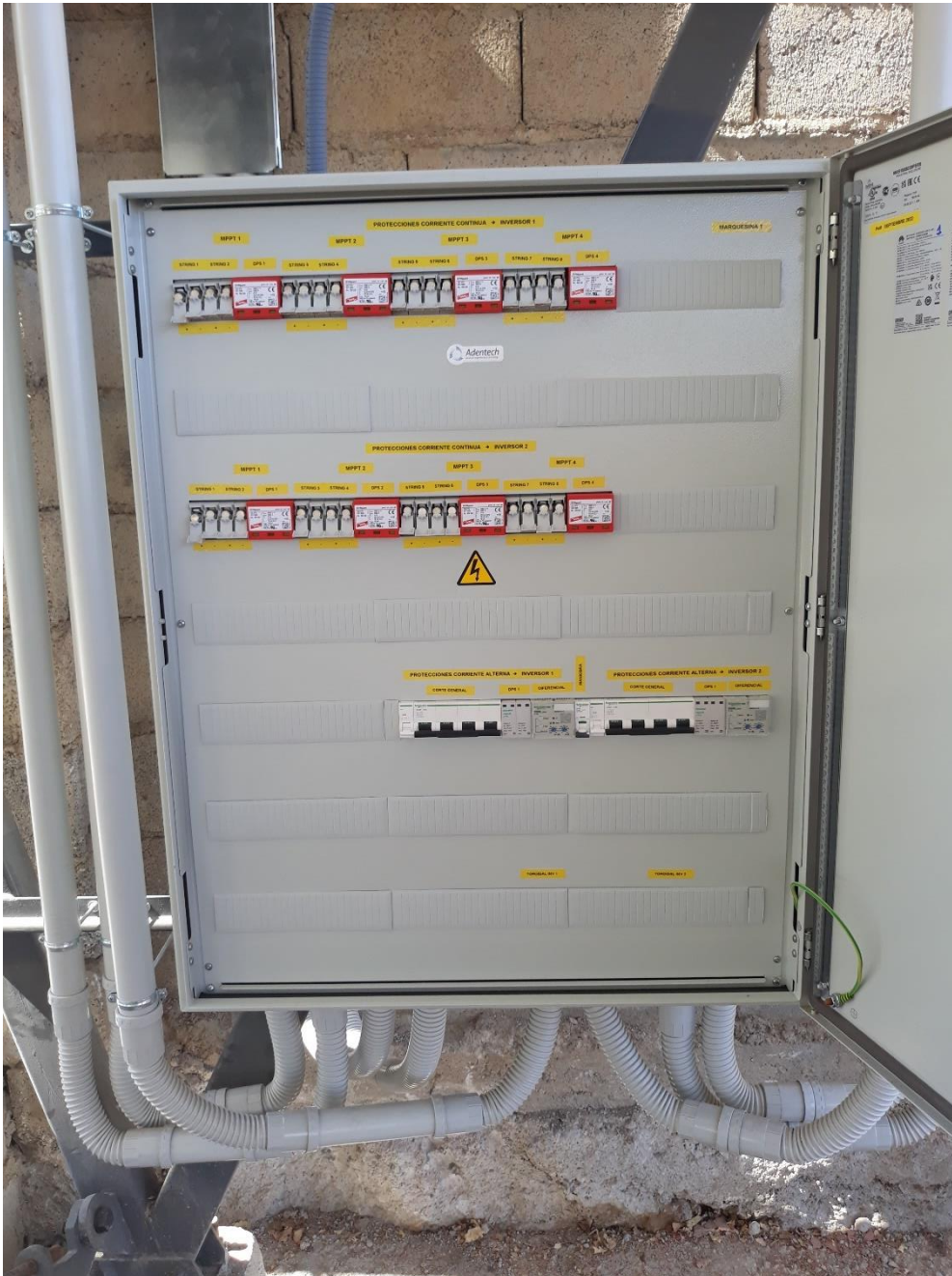
2021/2/REDIP/1-8.- Proyecto: Centro La Milagrosa. Mejora de eficiencia energética de instalaciones térmicas y Instalación solar fotovoltaica en edificio "Psicopedagógico" EN EL MARCO PROYECTOS SINGULARES DE ECONOMÍA BAJA EN CARBONO PARA SER COFINANCIADOS MEDIANTE EL PROGRAMA OPERATIVO FEDER DE CRECIMIENTO SOSTENIBLE 2014-2020

Dirección General de Obras Públicas y Vivienda