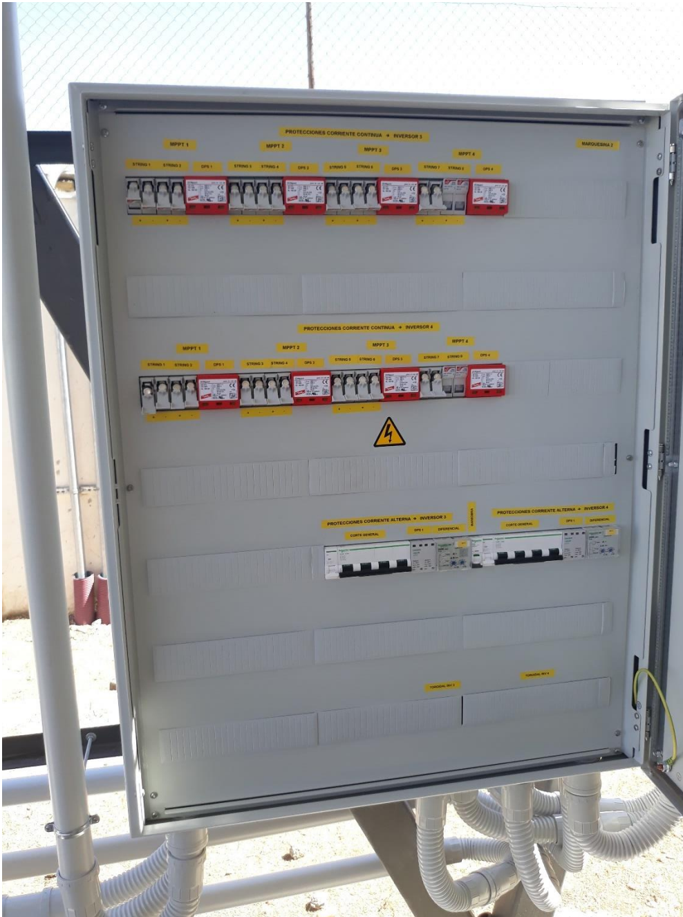
2021/2/REDIP/1-8.- Proyecto: Centro La Milagrosa. Mejora de eficiencia energética de instalaciones térmicas y Instalación solar fotovoltaica en edificio "Psicopedagógico" EN EL MARCO PROYECTOS SINGULARES DE ECONOMÍA BAJA EN CARBONO PARA SER COFINANCIADOS MEDIANTE EL PROGRAMA OPERATIVO FEDER DE CRECIMIENTO SOSTENIBLE 2014-2020

Dirección General de Obras Públicas y Vivienda