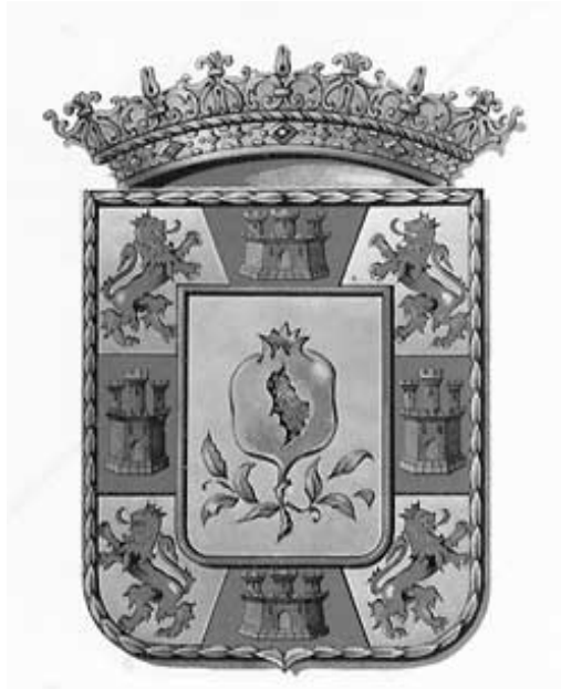
Imagen 9 Modelo del Escudo 1969