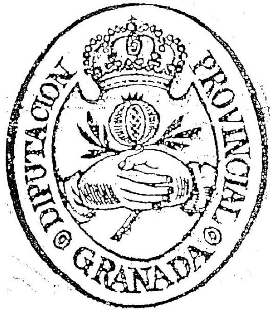
Imagen 1 Modelo del escudo de 1836