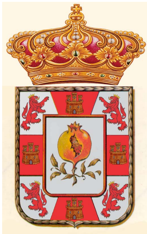
Imagen 10 Modelo del 2008