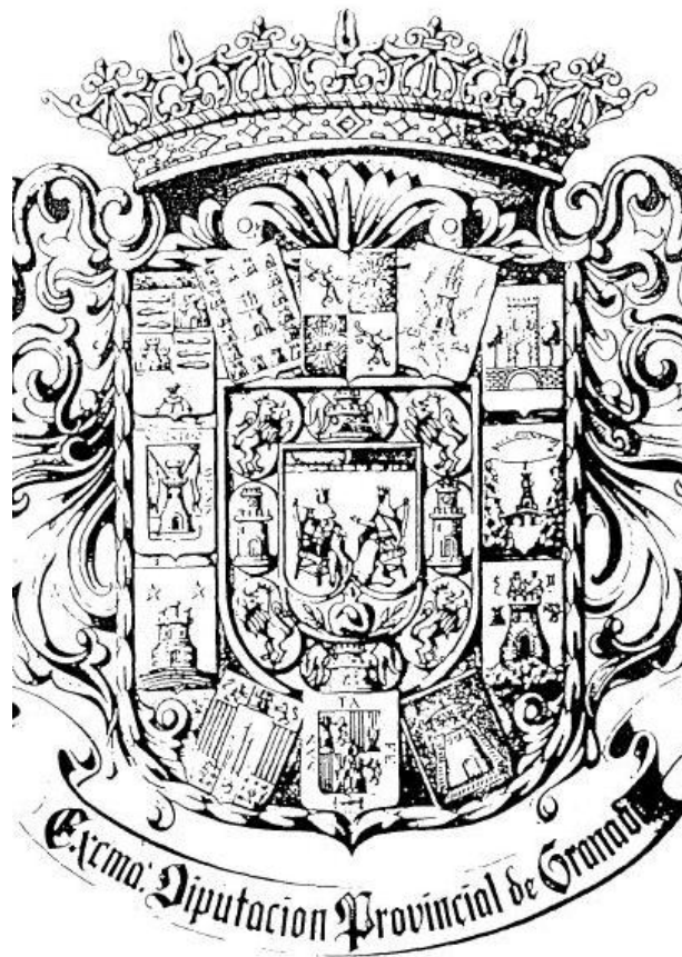
Imagen 7 Modelo del escudo 1959