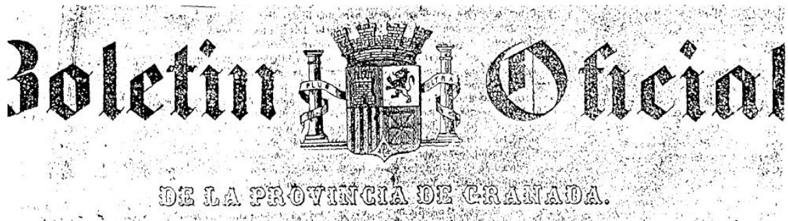
Imagen 2 Modelo del Escudo 1873-1874 (1ª Republica)