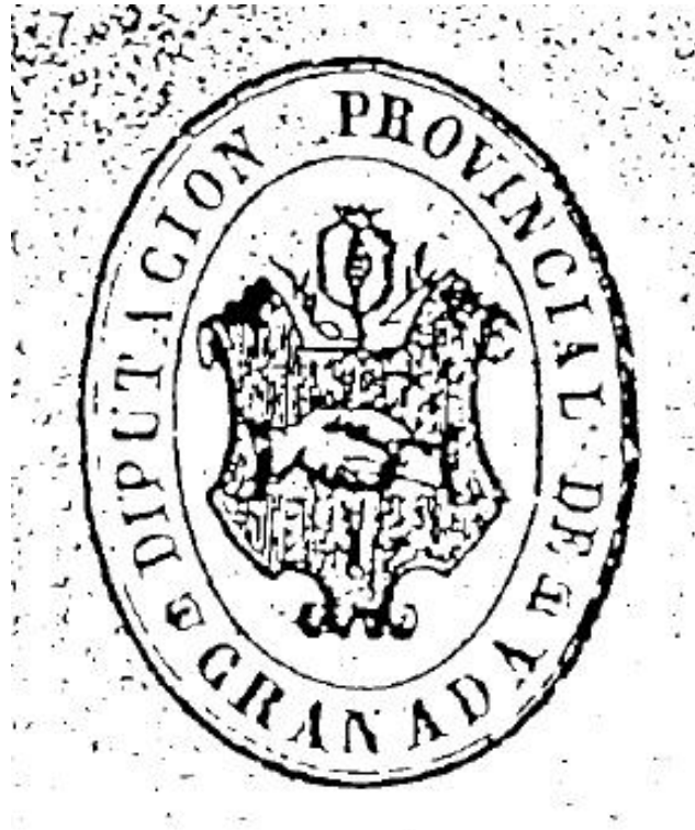
Imagen 3 Modelo del escudo de 1891