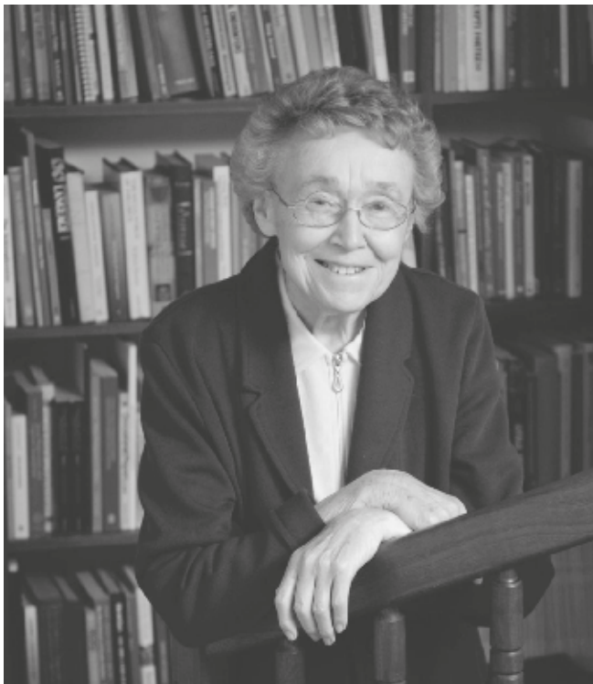
Lorna Wing, (7 de octubre de 1928 - 6 de junio de 2014).

Finalmente, en 1990 se incluyó el término Síndrome de Asperger en el Manual Estadístico de Diagnóstico de Trastornos Mentales (DSM-IV), casi 50 años después de que Hans Asperger publicara por primera vez acerca del trastorno.