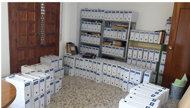
CENTRO SOCIAL SIN COLOCAR EN LAS ESTANTERIAS (DOCUMENTACION QUE ESTABA EN EL ZULO)