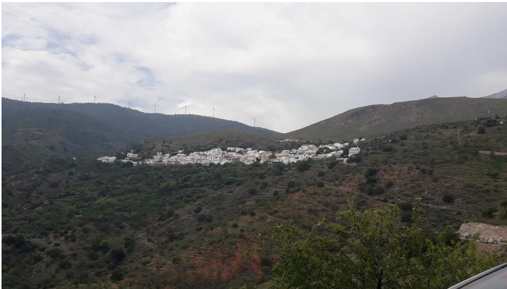
VISTA DE LÚJAR.

Lújar es una localidad y municipio español situado en la parte central de la comarca de la Costa Granadina, en la provincia de Granada, comunidad autónoma de Andalucía. A orillas del mar Mediterráneo, este municipio limita con los de Gualchos, Motril, Vélez de Benaudalla, Órgiva y Rubite.