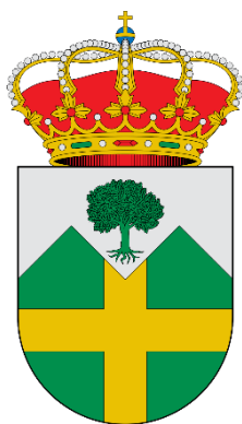
ESCUDO DE LÚJAR.

El municipio lujeno comprende los núcleos de población de Lújar — capital municipal— y Los Carlos, así como los diseminados de Cambriles, Castillo, Corral de la Fuente de la Higuera, Espinar Alto, Los García, Miró, Las Piedras, Rubiales, Venta El Álamo y La Venta de Lújar, entre otros.