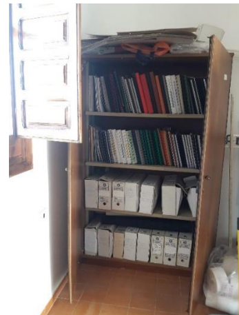
HABITACION DE ATRÁS DEL AYUNTAMIENTO