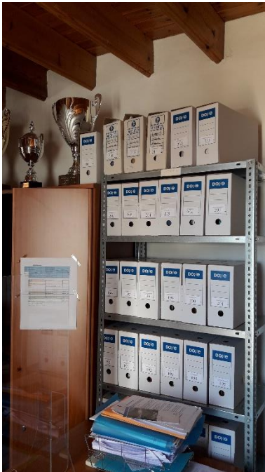
MUEBLES EN EL DESPACHO DE LA SECRETARIA