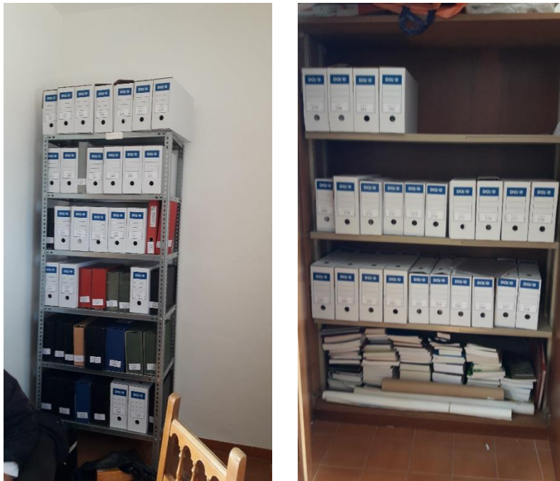
ARCHIVO EN LA HABITACION DE ATRÁS DEL AYUNTAMIENTO