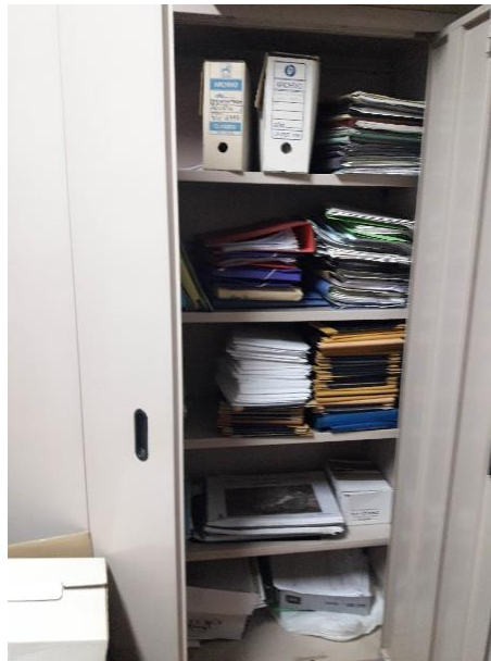
HABITACIÓN DEL FONDO DEL AYUNTAMIENTO.

Otra parte de la documentación a informatizar estaba en una habitación que, formando parte del edificio municipal, tiene su entrada por una calle trasera. En dicha habitación predominaban sobre todo proyectos de arquitectura e ingeniería y documentación sobre urbanismo, aunque hay también documentación económica y del juzgado de paz.