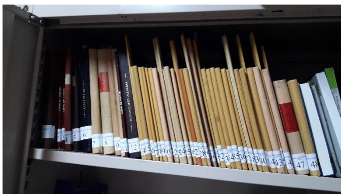
LIBROS EN EL ARCHIVO DEL EDIFICIO DEL AYUNTAMIENTO

Finalmente el archivo quedó como se muestra a continuación: