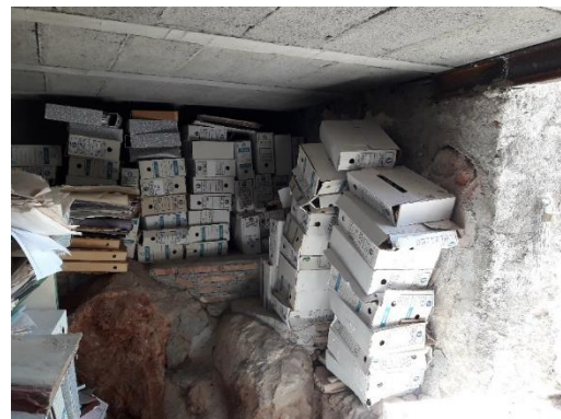
SITUACIÓN DE LOS DOCUMENTOS EN EL ZULO.