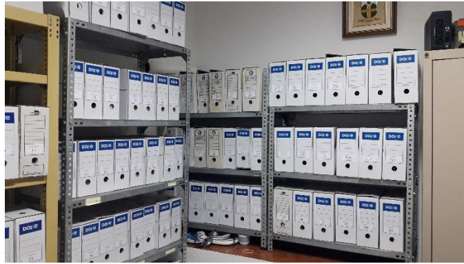
HABITACION DE ARCHIVO DEL AYUNTAMIENTO