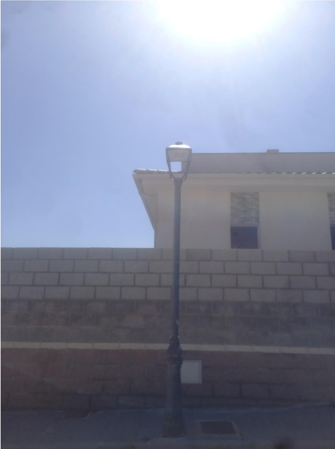
2019/2/EBCAR-160 "HUÉTOR SANTILLÁN, Reducción de emisiones de CO2 en el alumbrado público exterior del municipio de Huétor Santillán". EN EL MARCO PROYECTOS SINGULARES DE ECONOMÍA BAJA EN CARBONO PARA SER COFINANCIADOS MEDIANTE EL PROGRAMA OPERATIVO FEDER DE CRECIMIENTO SOSTENIBLE 2014-2020

Dirección General de Obras Públicas y Vivienda