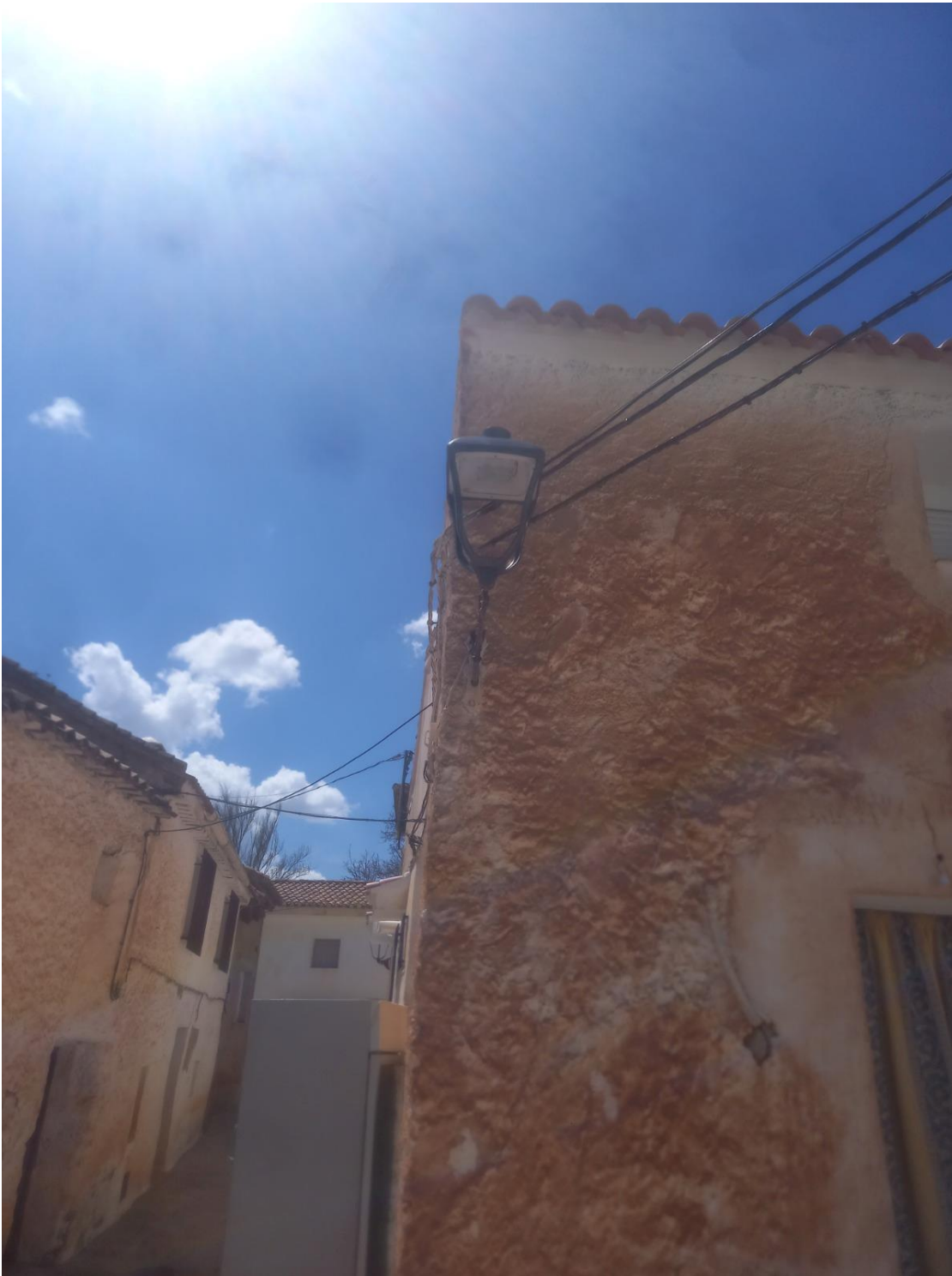
2019/2/EBCAR-160 "HUÉTOR SANTILLÁN, Reducción de emisiones de CO2 en el alumbrado público exterior del municipio de Huétor Santillán". EN EL MARCO PROYECTOS SINGULARES DE ECONOMÍA BAJA EN CARBONO PARA SER COFINANCIADOS MEDIANTE EL PROGRAMA OPERATIVO FEDER DE CRECIMIENTO SOSTENIBLE 2014-2020

Dirección General de Obras Públicas y Vivienda