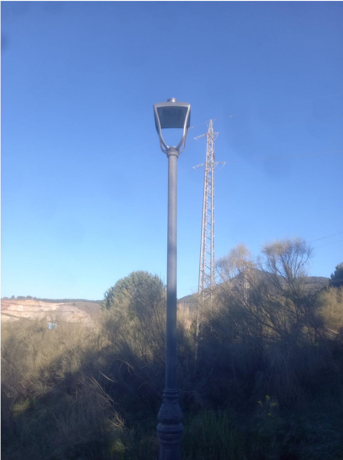
2019/2/EBCAR-160 "HUÉTOR SANTILLÁN, Reducción de emisiones de CO2 en el alumbrado público exterior del municipio de Huétor Santillán". EN EL MARCO PROYECTOS SINGULARES DE ECONOMÍA BAJA EN CARBONO PARA SER COFINANCIADOS MEDIANTE EL PROGRAMA OPERATIVO FEDER DE CRECIMIENTO SOSTENIBLE 2014-2020

Dirección General de Obras Públicas y Vivienda