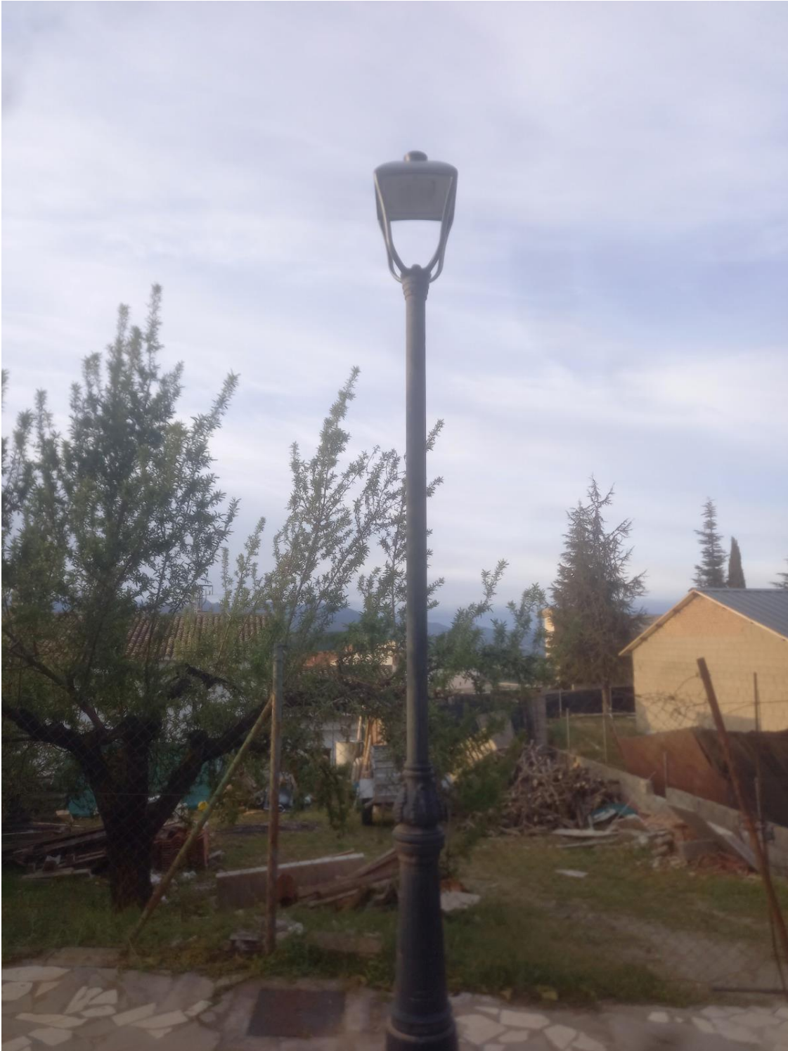
2019/2/EBCAR-160 "HUÉTOR SANTILLÁN, Reducción de emisiones de CO2 en el alumbrado público exterior del municipio de Huétor Santillán". EN EL MARCO PROYECTOS SINGULARES DE ECONOMÍA BAJA EN CARBONO PARA SER COFINANCIADOS MEDIANTE EL PROGRAMA OPERATIVO FEDER DE CRECIMIENTO SOSTENIBLE 2014-2020

Dirección General de Obras Públicas y Vivienda