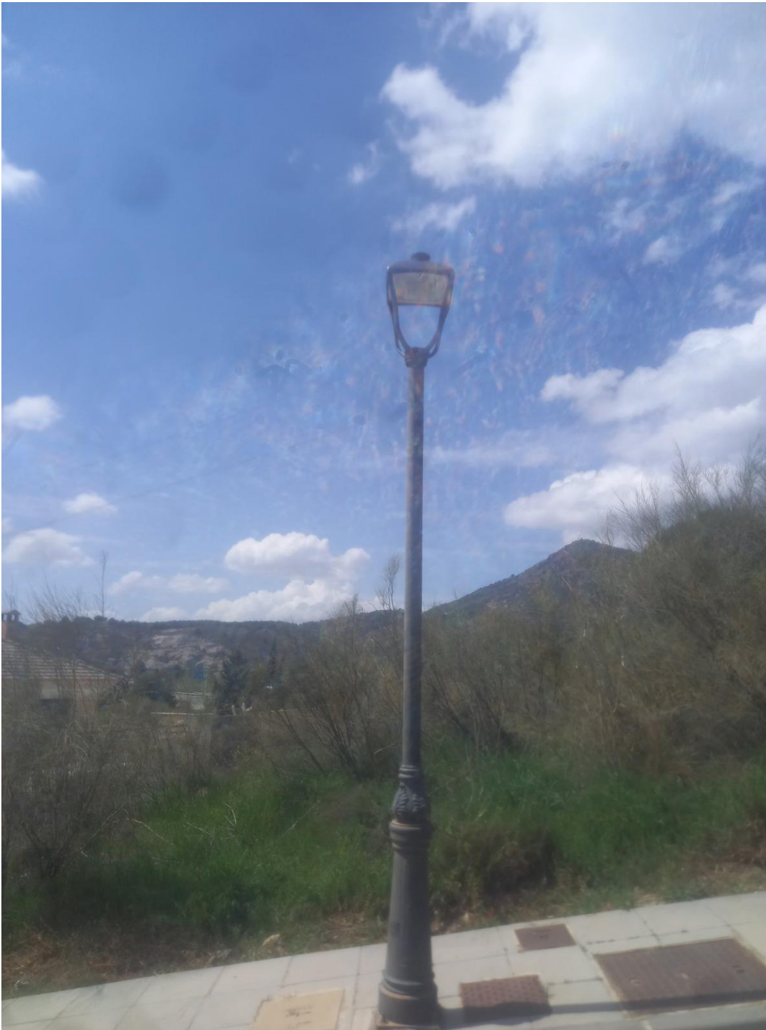
2019/2/EBCAR-160 "HUÉTOR SANTILLÁN, Reducción de emisiones de CO2 en el alumbrado público exterior del municipio de Huétor Santillán". EN EL MARCO PROYECTOS SINGULARES DE ECONOMÍA BAJA EN CARBONO PARA SER COFINANCIADOS MEDIANTE EL PROGRAMA OPERATIVO FEDER DE CRECIMIENTO SOSTENIBLE 2014-2020

Dirección General de Obras Públicas y Vivienda