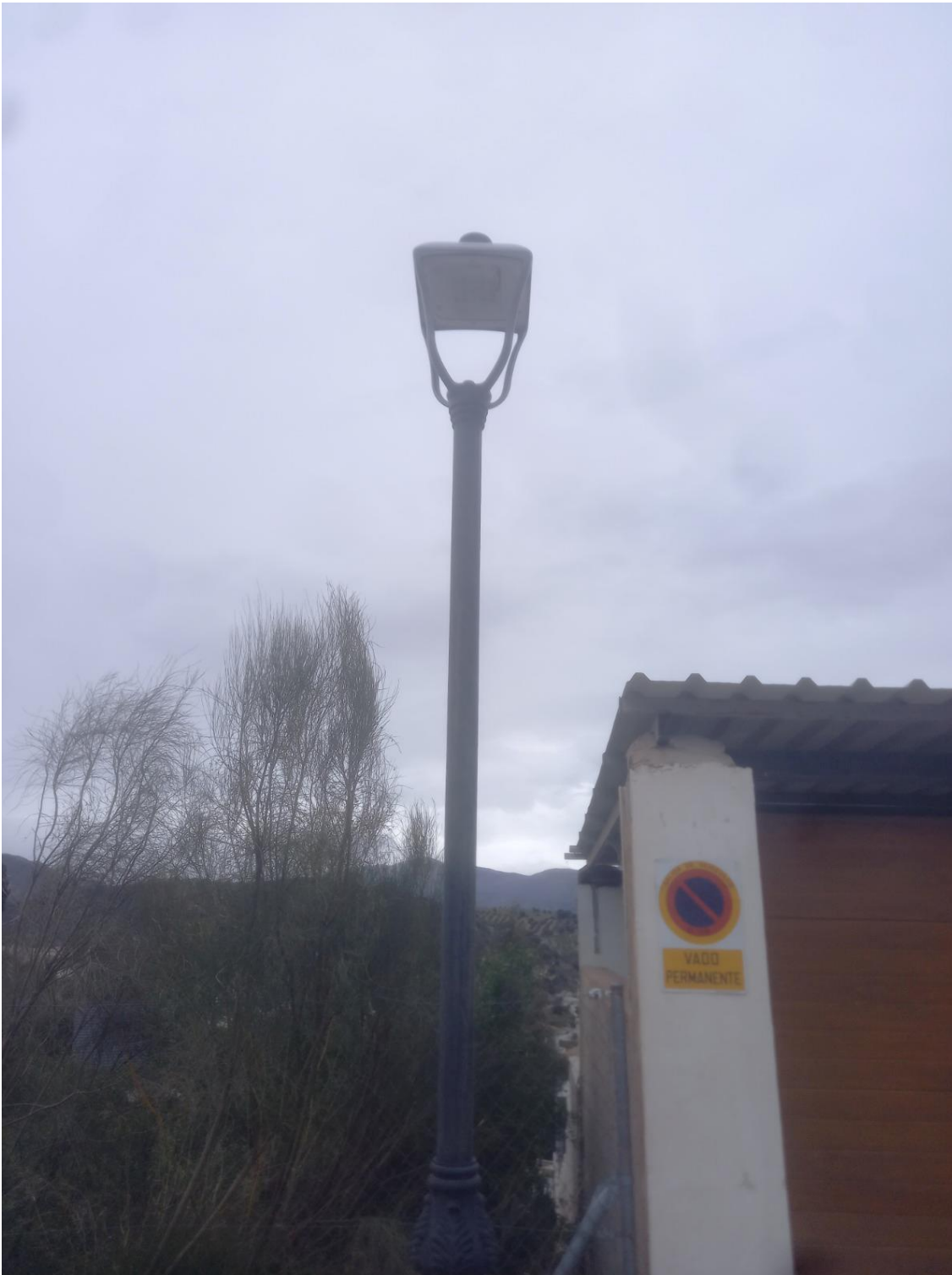
2019/2/EBCAR-160 "HUÉTOR SANTILLÁN, Reducción de emisiones de CO2 en el alumbrado público exterior del municipio de Huétor Santillán". EN EL MARCO PROYECTOS SINGULARES DE ECONOMÍA BAJA EN CARBONO PARA SER COFINANCIADOS MEDIANTE EL PROGRAMA OPERATIVO FEDER DE CRECIMIENTO SOSTENIBLE 2014-2020

Dirección General de Obras Públicas y Vivienda