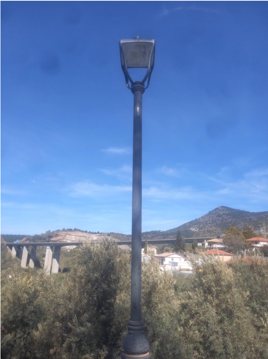
2019/2/EBCAR-160 "HUÉTOR SANTILLÁN, Reducción de emisiones de CO2 en el alumbrado público exterior del municipio de Huétor Santillán". EN EL MARCO PROYECTOS SINGULARES DE ECONOMÍA BAJA EN CARBONO PARA SER COFINANCIADOS MEDIANTE EL PROGRAMA OPERATIVO FEDER DE CRECIMIENTO SOSTENIBLE 2014-2020

Dirección General de Obras Públicas y Vivienda