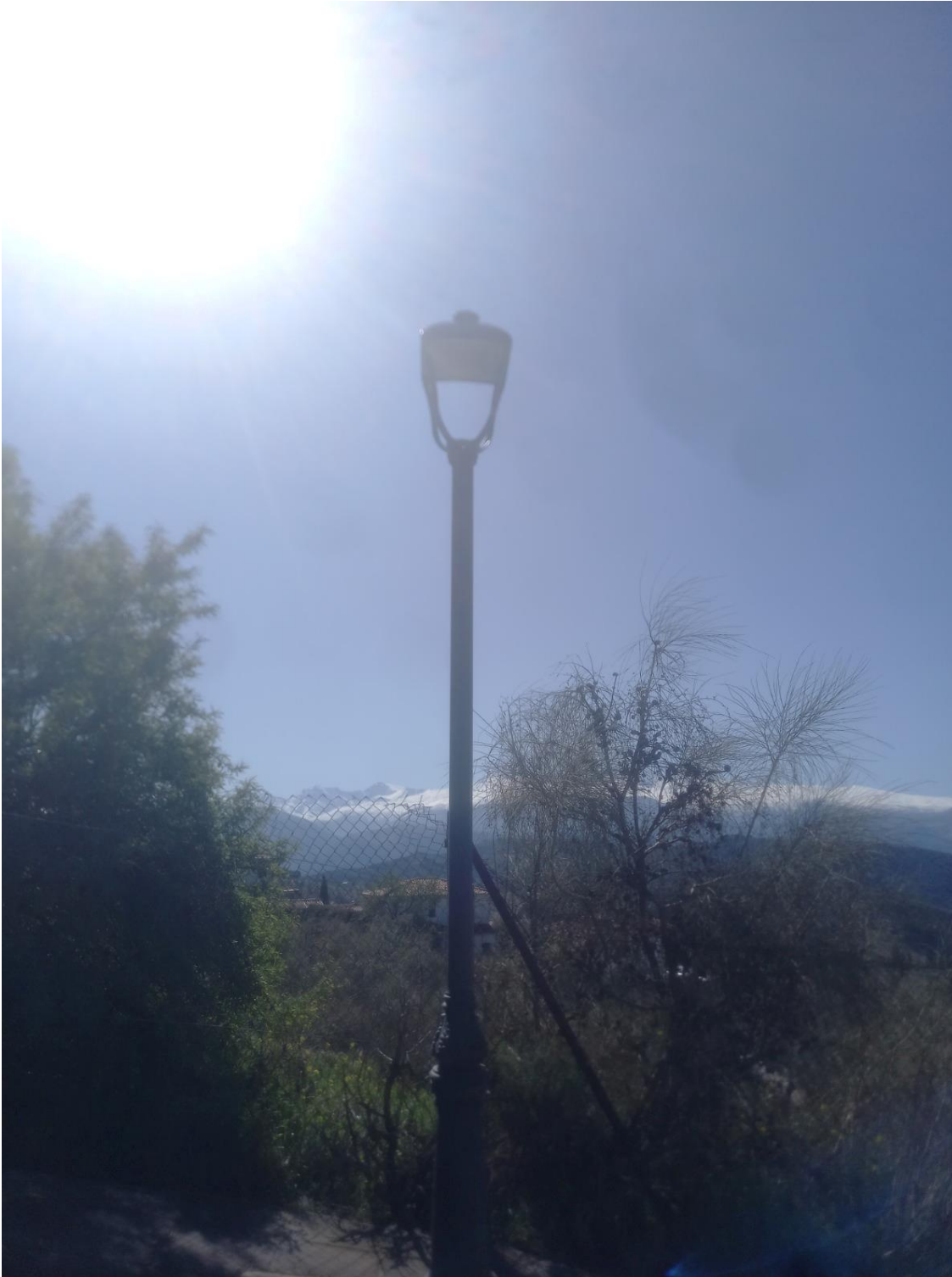
2019/2/EBCAR-160 "HUÉTOR SANTILLÁN, Reducción de emisiones de CO2 en el alumbrado público exterior del municipio de Huétor Santillán". EN EL MARCO PROYECTOS SINGULARES DE ECONOMÍA BAJA EN CARBONO PARA SER COFINANCIADOS MEDIANTE EL PROGRAMA OPERATIVO FEDER DE CRECIMIENTO SOSTENIBLE 2014-2020

Dirección General de Obras Públicas y Vivienda