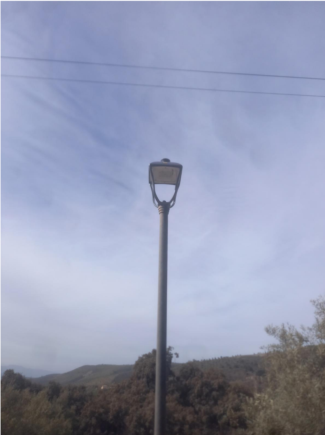
2019/2/EBCAR-160 "HUÉTOR SANTILLÁN, Reducción de emisiones de CO2 en el alumbrado público exterior del municipio de Huétor Santillán". EN EL MARCO PROYECTOS SINGULARES DE ECONOMÍA BAJA EN CARBONO PARA SER COFINANCIADOS MEDIANTE EL PROGRAMA OPERATIVO FEDER DE CRECIMIENTO SOSTENIBLE 2014-2020

Dirección General de Obras Públicas y Vivienda