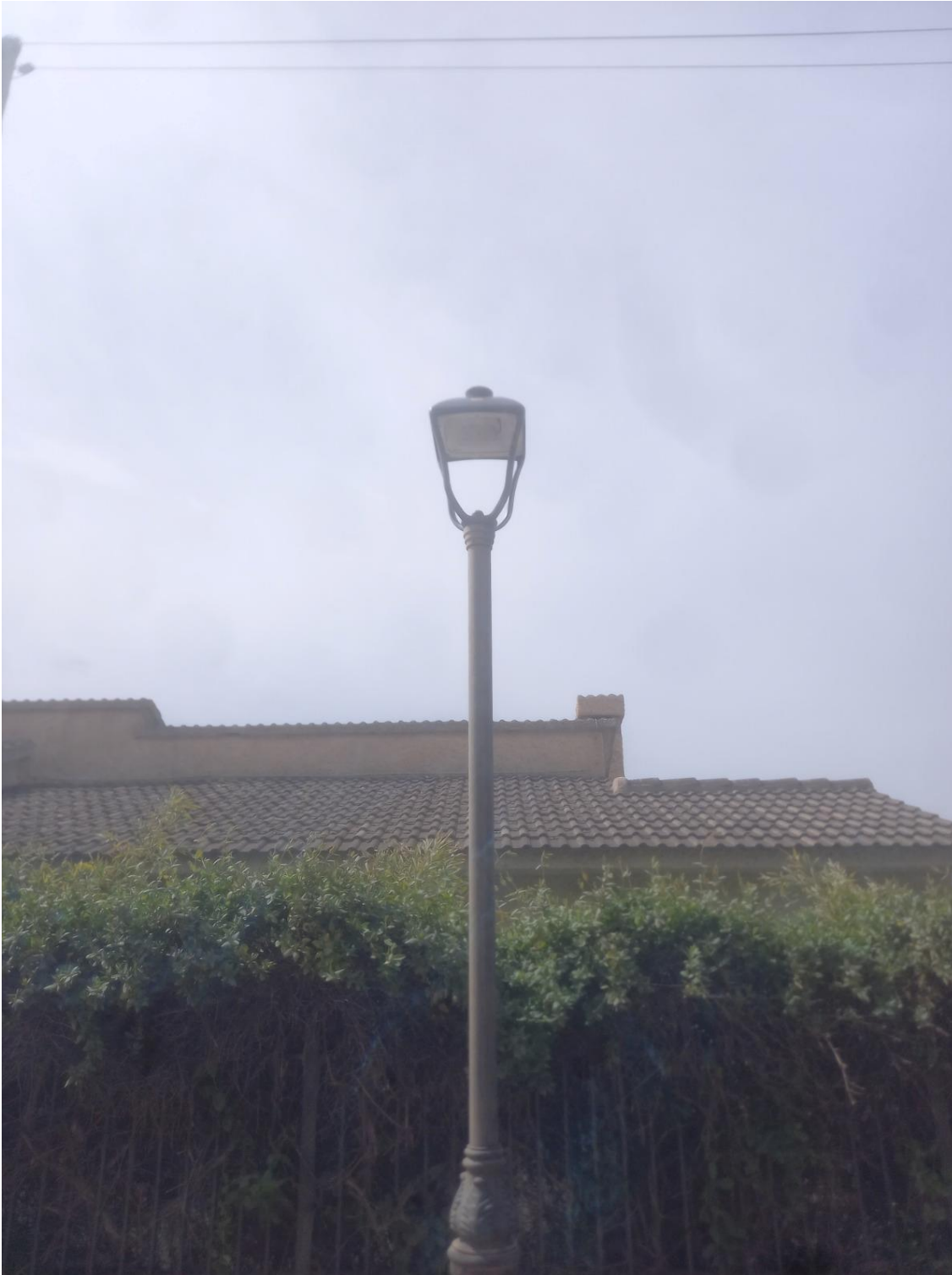
2019/2/EBCAR-160 "HUÉTOR SANTILLÁN, Reducción de emisiones de CO2 en el alumbrado público exterior del municipio de Huétor Santillán". EN EL MARCO PROYECTOS SINGULARES DE ECONOMÍA BAJA EN CARBONO PARA SER COFINANCIADOS MEDIANTE EL PROGRAMA OPERATIVO FEDER DE CRECIMIENTO SOSTENIBLE 2014-2020

Dirección General de Obras Públicas y Vivienda