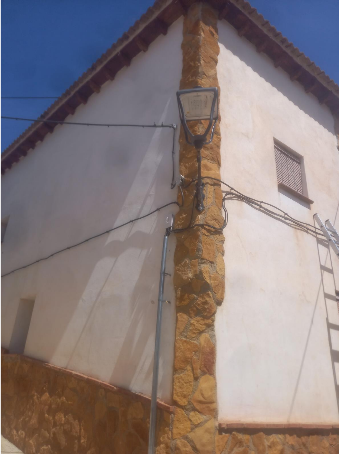
2019/2/EBCAR-160 "HUÉTOR SANTILLÁN, Reducción de emisiones de CO2 en el alumbrado público exterior del municipio de Huétor Santillán". EN EL MARCO PROYECTOS SINGULARES DE ECONOMÍA BAJA EN CARBONO PARA SER COFINANCIADOS MEDIANTE EL PROGRAMA OPERATIVO FEDER DE CRECIMIENTO SOSTENIBLE 2014-2020

Dirección General de Obras Públicas y Vivienda