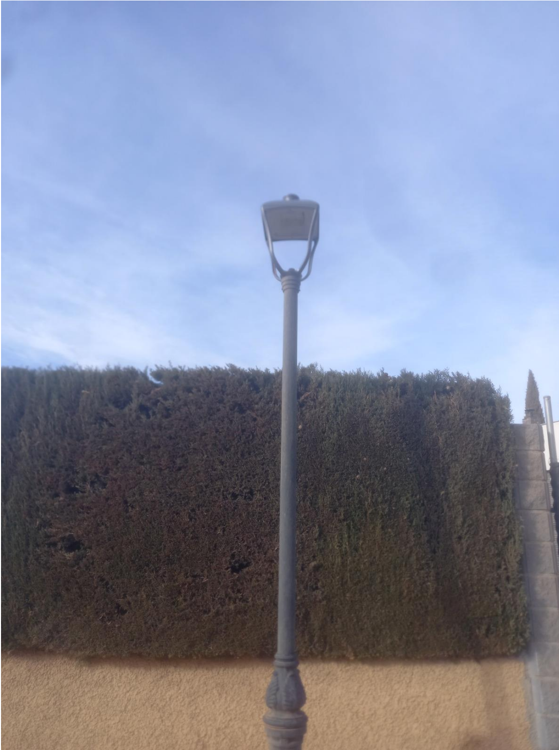
2019/2/EBCAR-160 "HUÉTOR SANTILLÁN, Reducción de emisiones de CO2 en el alumbrado público exterior del municipio de Huétor Santillán". EN EL MARCO PROYECTOS SINGULARES DE ECONOMÍA BAJA EN CARBONO PARA SER COFINANCIADOS MEDIANTE EL PROGRAMA OPERATIVO FEDER DE CRECIMIENTO SOSTENIBLE 2014-2020

Dirección General de Obras Públicas y Vivienda