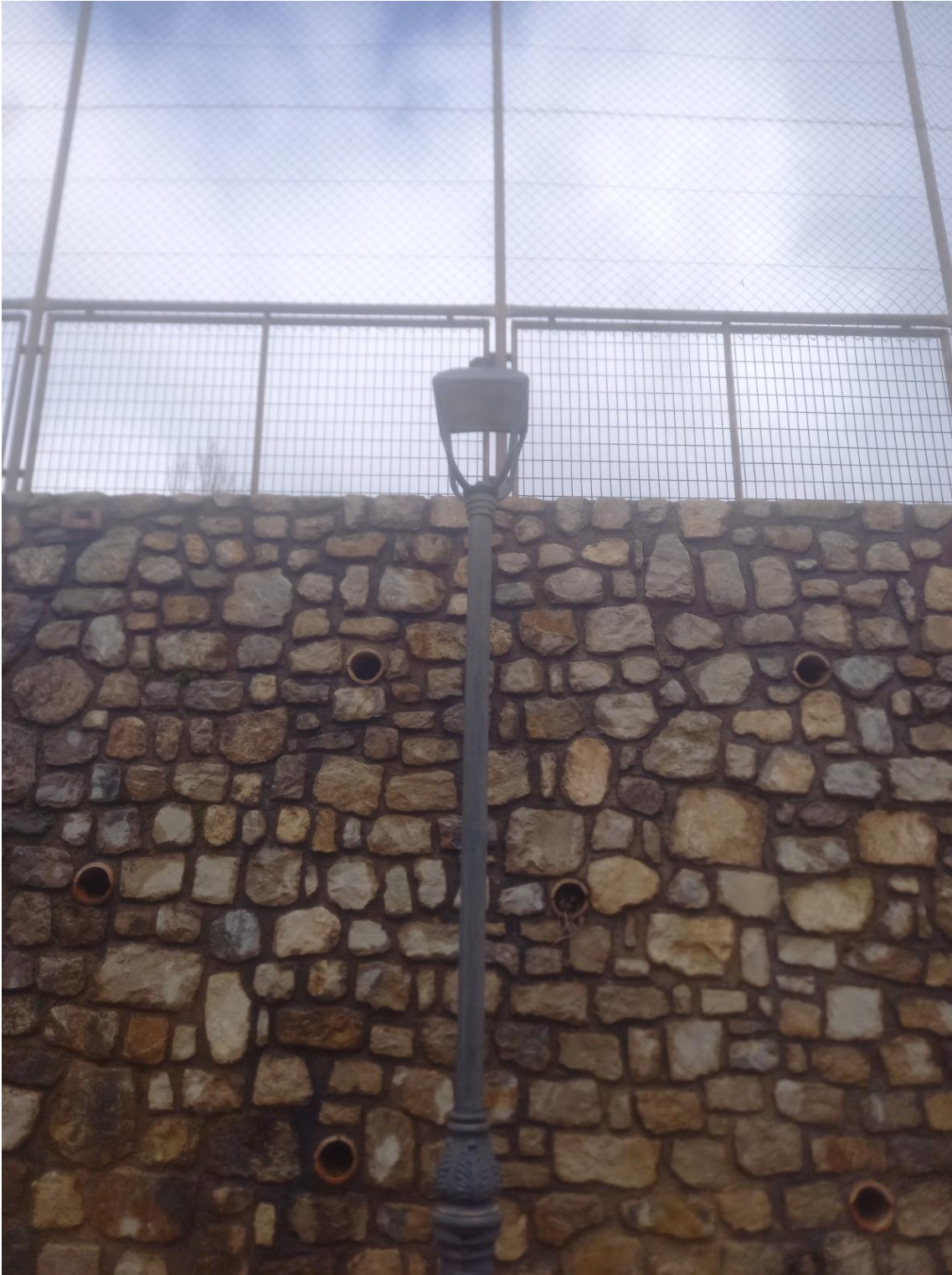
2019/2/EBCAR-160 "HUÉTOR SANTILLÁN, Reducción de emisiones de CO2 en el alumbrado público exterior del municipio de Huétor Santillán". EN EL MARCO PROYECTOS SINGULARES DE ECONOMÍA BAJA EN CARBONO PARA SER COFINANCIADOS MEDIANTE EL PROGRAMA OPERATIVO FEDER DE CRECIMIENTO SOSTENIBLE 2014-2020

Dirección General de Obras Públicas y Vivienda