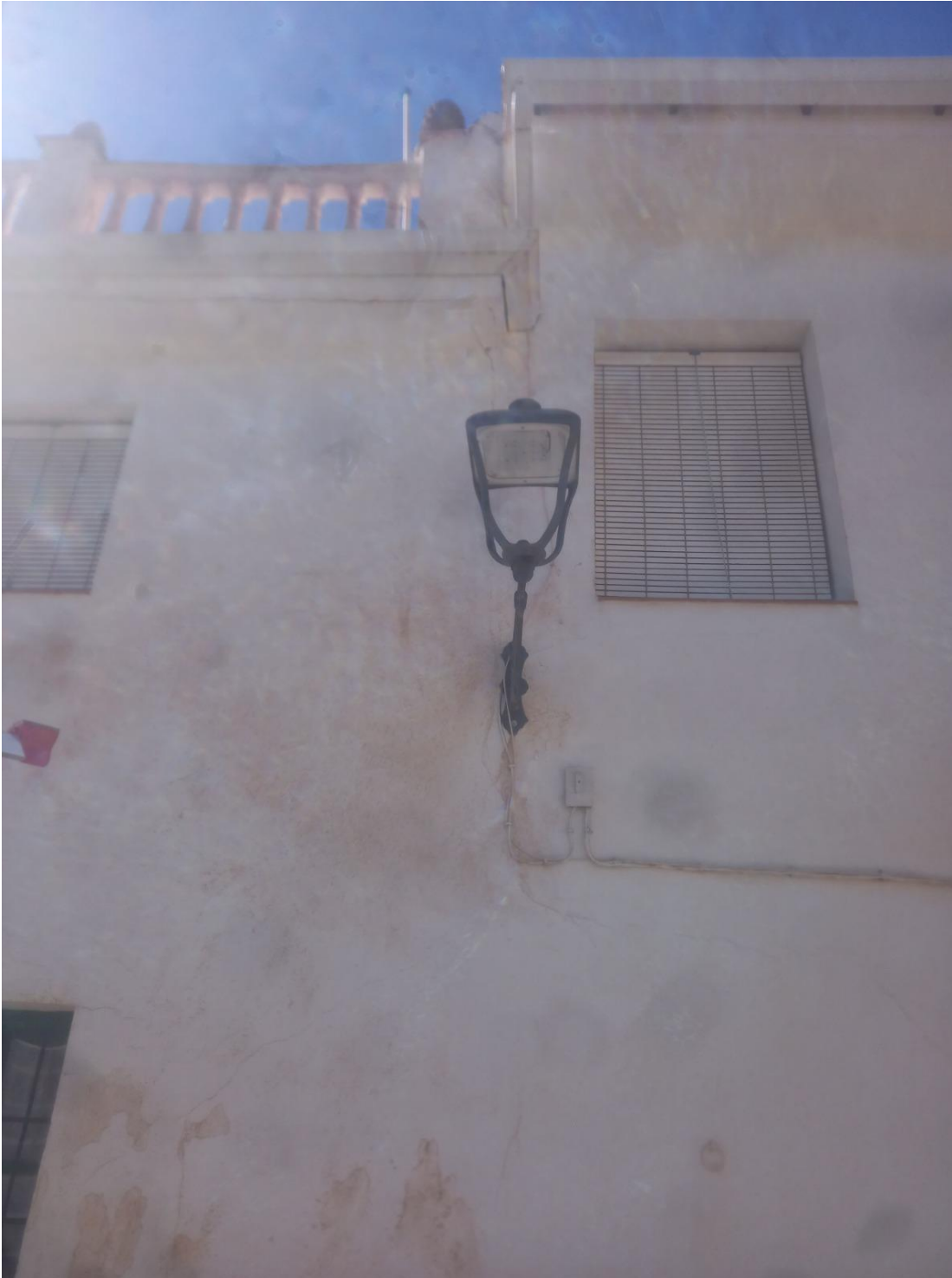
2019/2/EBCAR-160 "HUÉTOR SANTILLÁN, Reducción de emisiones de CO2 en el alumbrado público exterior del municipio de Huétor Santillán". EN EL MARCO PROYECTOS SINGULARES DE ECONOMÍA BAJA EN CARBONO PARA SER COFINANCIADOS MEDIANTE EL PROGRAMA OPERATIVO FEDER DE CRECIMIENTO SOSTENIBLE 2014-2020

Dirección General de Obras Públicas y Vivienda