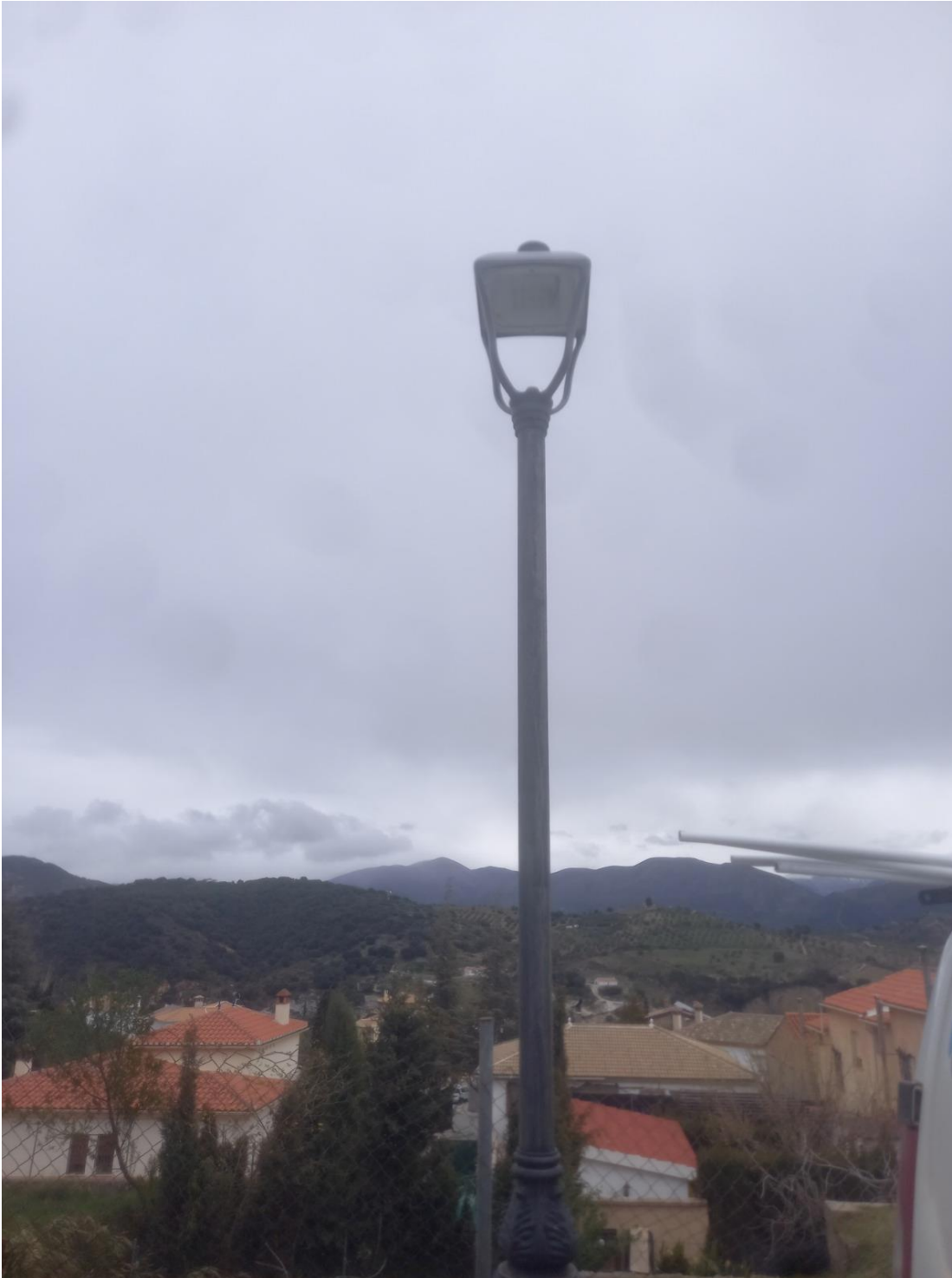
2019/2/EBCAR-160 "HUÉTOR SANTILLÁN, Reducción de emisiones de CO2 en el alumbrado público exterior del municipio de Huétor Santillán". EN EL MARCO PROYECTOS SINGULARES DE ECONOMÍA BAJA EN CARBONO PARA SER COFINANCIADOS MEDIANTE EL PROGRAMA OPERATIVO FEDER DE CRECIMIENTO SOSTENIBLE 2014-2020

Dirección General de Obras Públicas y Vivienda