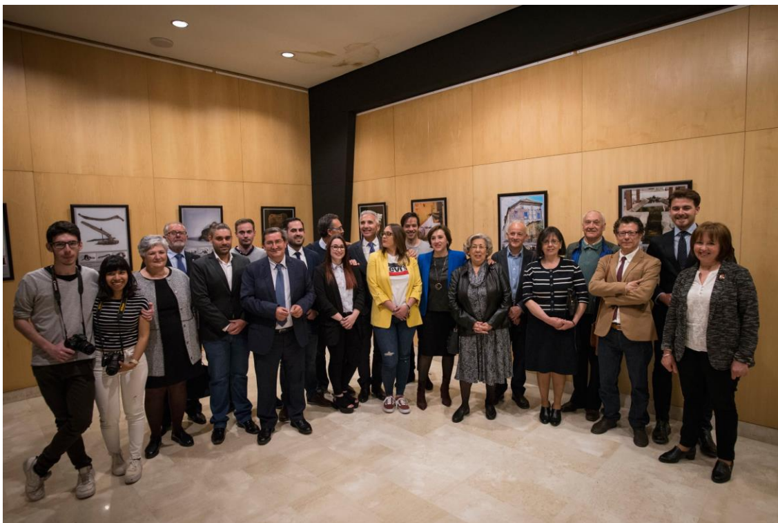
Inauguración en el Centro de Arte Rey Chico de Granada con la asistencia del Consejero de Cultura Miguel Ángel Vázquez, y el presidente de la Diputación de Granada, José Entrena Ávila, entre numerosas autoridades.

La aportación de Escuela Arte Granada a este evento se traduce en una serie de acciones abordadas desde diferentes disciplinas artísticas que todas juntas conformaran una exposición colectiva del alumnado de este curso académico, destacamos las siguientes por departamentos: